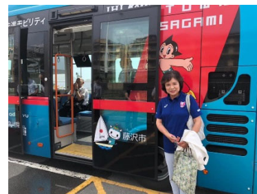
自動運転バスの実証実験にて(8/22江の島)

リティ研究会」を通じて、国、県内全ての市町村、民間事業者と連携し、スマートモビリティ社会の実現に向けた取組みを推進していく、との答弁がありました。