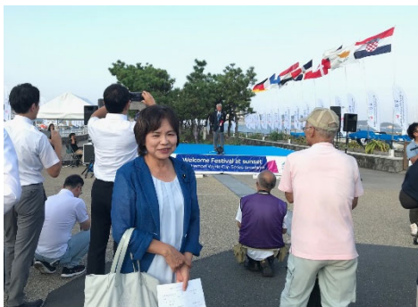
セーリングW杯江ノ島大会 ウェルカムフェスティバルにて