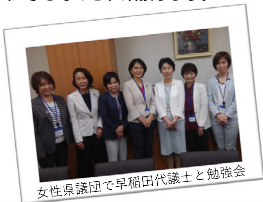
女性県議団で早稲田代議士と勉強会

立憲民主党・民権クラブ26人のうち女性議員6人、新人議員11人。会派内では、予算要望や視察の検討、政策の取りまとめなどを行う政務調査会のメンバーとなりました。先輩議員に学びながら、頑張ります。