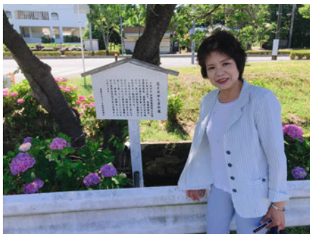
遠藤あじさい祭りにて